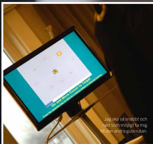
Jag ska så snabbt och rakt som möjligt ta mig till den andra gula rutan.