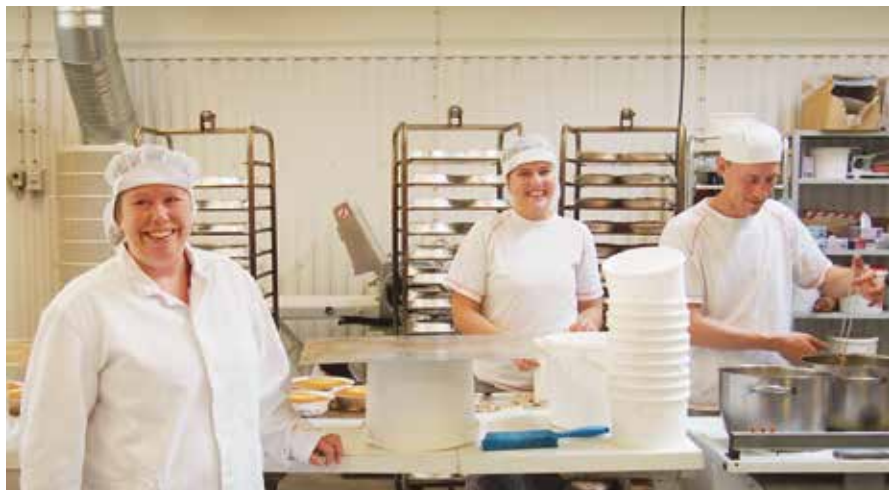
Rojos var partnerföretag till 2015 års vinnande projektgrupp.