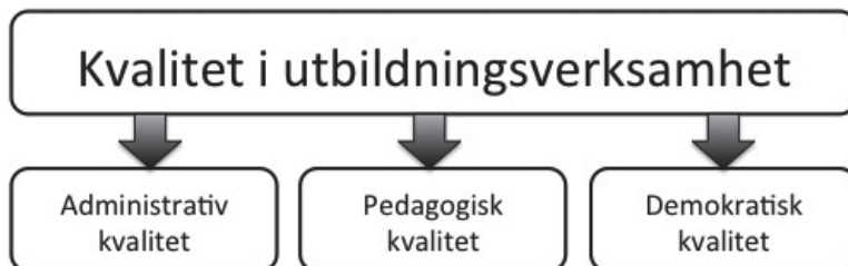
Figur 2. Kvalitetstypologi för vuxenutbildningsverksamhet.

Denna kvalitetstypologi förtydligar olika dimensioner som svarar mot olika mål på både nationell, kommun- och verksamhetsnivå inom vuxenutbildningen.